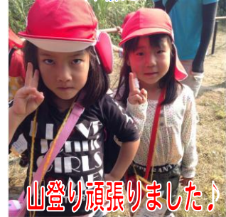
山登り頑張りました!