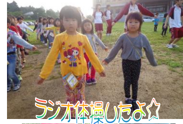
ラジオ体操したよ☆

朝の気持ちのよい風の中、朝の集いに参加して、ラジオ 体操をしました。朝ごはんの前に4つめのシールもゲット♪ いよいよえぼしへやまのぼり!!佐世保の町を見下ろせる 頂上はとっても気持ちいい♪ヤッタークリア!!