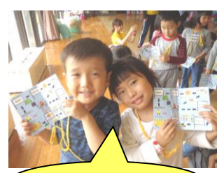
1つめのシールゲット~♪

えぼしでのお泊り保育が始まりました♪ ワクワク・ドキドキしながらも、“おとまりカード”を首にかけ、 元気よく出発できましたよ!! いよいよ烏帽子に到着!!入所式でご挨拶すると ペンちゃんから手紙が・・・ お泊り保育のあいことば 「やれる!できる!がんばれる!!力を合わせてレッツゴー!」 を守って、5つのシールをゲットしよう♪