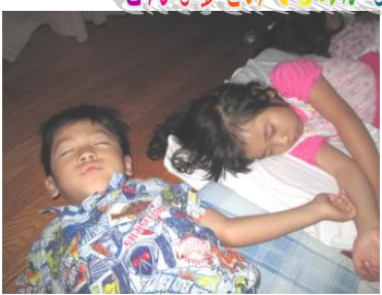
どんな夢をみてるのかな~(i x)