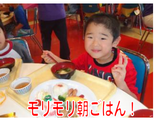
モリモリ朝ごはん!